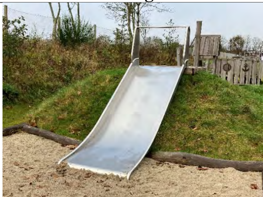
Redskab: Terrænruksjebane Årgang: 2021 Producent: Guldborg Er redskabet mærket: Ja Er der registreret fejl/mangler: Nej