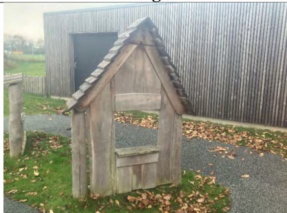
Redskab: Facade  rgang: 2022 Producent: Nikoplay Er redskabet m rket: Ja Er der registreret fejl/mangler: Nej