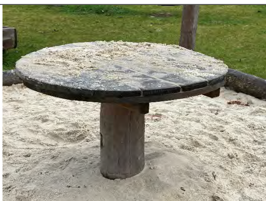
Redskab: Årgang: 2022 Producent: Nikoplay Er redskabet mærket: Ja Er der registreret fejl/mangler: Nej