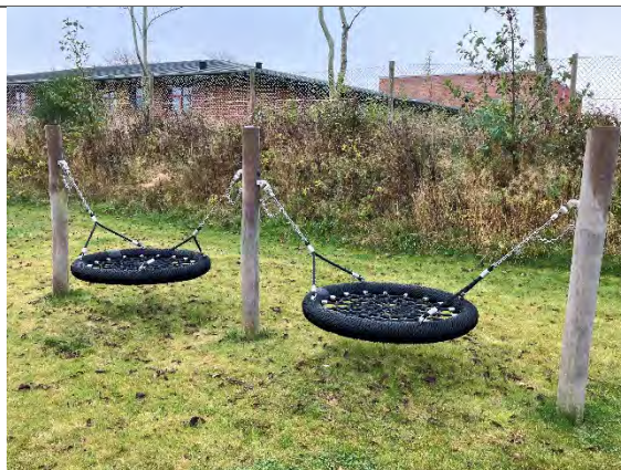
Redskab: Fugleredegynge  rgang: 2022 Producent: Nikoplay Er redskabet m rket: Ja Er der registreret fejl/mangler: Nej