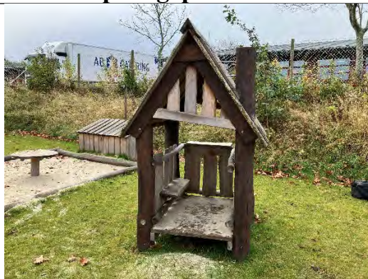
Redskab: Legehus Årgang: 2022 Producent: Nikoplay Er redskabet mærket: Ja Er der registreret fejl/mangler: Nej