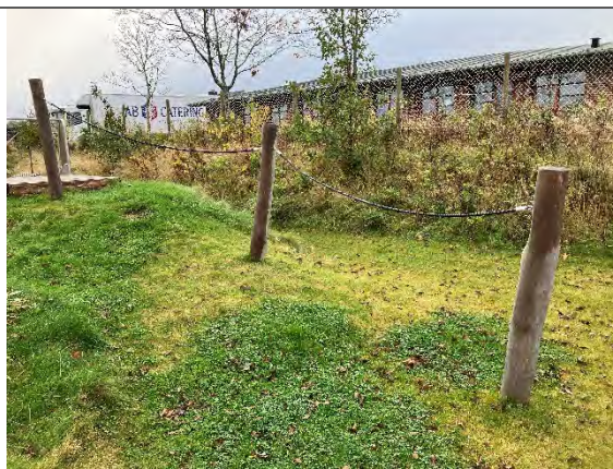
Redskab: Klatrenet  rgang: 2022 Producent: Nikoplay Er redskabet m rket: Ja Er der registreret fejl/mangler: Nej