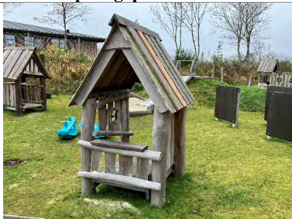
Redskab: Årgang: 2022 Producent: Nikoplay Er redskabet mærket: Ja Er der registreret fejl/mangler: Ja