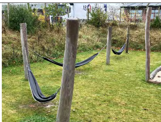
Redskab: Årgang: 2022 Producent: Nikoplay Er redskabet mærket: Ja Er der registreret fejl/mangler: Nej