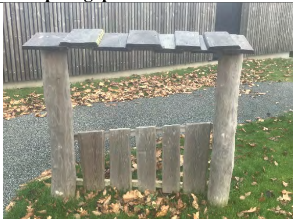
Redskab: Facade  rgang: 2022 Producent: Nikoplay Er redskabet m rket: Ja Er der registreret fejl/mangler: Nej