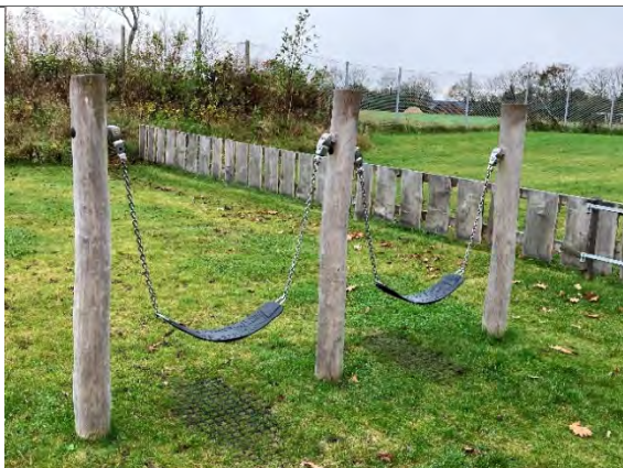
Redskab: Mavegynger  rgang: 2022 Producent: Nikoplay Er redskabet m rket: Ja Er der registreret fejl/mangler: Nej