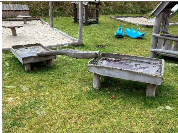
Redskab: Årgang: 2022 Producent: Nikoplay Er redskabet mærket: Ja Er der registreret fejl/mangler: Nej