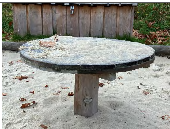
Redskab: Sandbord Årgang: 2022 Producent: Nikoplay Er redskabet mærket: Ja Er der registreret fejl/mangler: Nej