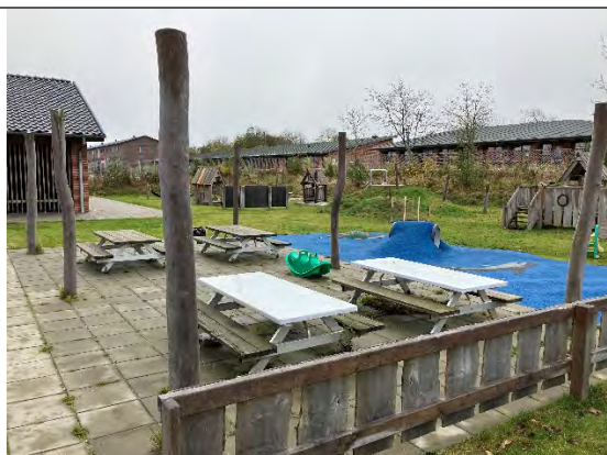
Redskab: Stolper til læsejl Årgang: 2022 Producent: Er redskabet mærket: Nej Er der registreret fejl/mangler: Nej