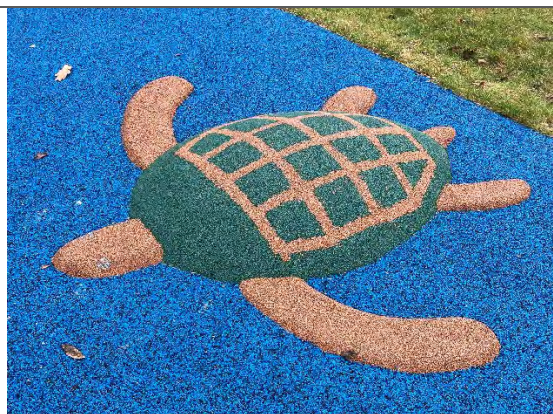
Redskab: Klatredyr Årgang: 2022 Producent: Er redskabet mærket: Nej Er der registreret fejl/mangler: Nej