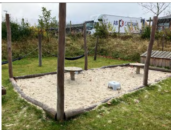
Redskab: Sandkasse med stolper til læsejl Årgang: Producent: Er redskabet mærket: Nej Er der registreret fejl/mangler: Nej