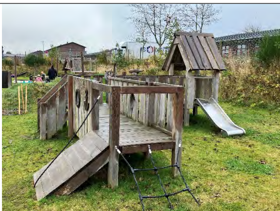
Redskab: Klatrestativ med rutsjebane  rgang: 2022 Producent: Nikoplay Er redskabet m rket: Ja Er der registreret fejl/mangler: Nej