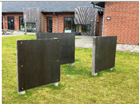
Redskab: Zigzag Årgang: 2022 Producent: Nikoplay Er redskabet mærket: Ja Er der registreret fejl/mangler: Nej