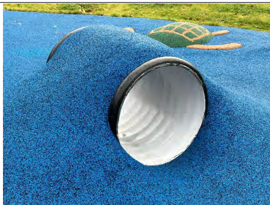
Redskab: Tunnel Årgang: 2022 Producent: Er redskabet mærket: Nej Er der registreret fejl/mangler: Nej